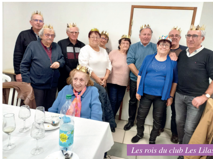
Les rois du club Les Lilas