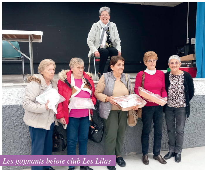
Les gagnants belote club Les Lilas

Pour tous renseignements, contacter Christiane MOREL : 06 33 88 19 44