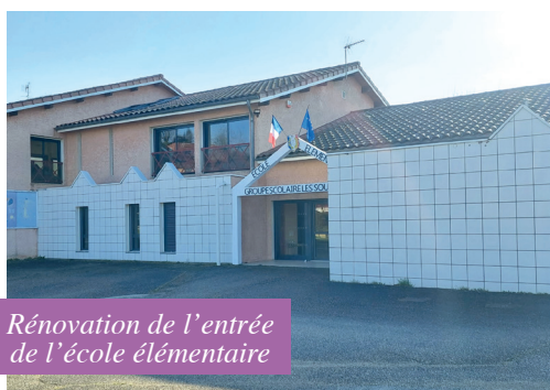
Rénovation de l'entrée de l'école élémentaire

Le Service Technique œuvre pour l'embellissement de notre village : nettoyage de la façade de l'école élémentaire, réfection de l'Arche repeinte en blanc avec lettres en noir, étanchéité de la fontaine (ancienne école). Dans la continuité, le monument aux morts sera restauré.