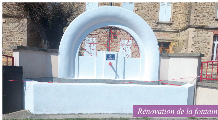
Rénovation de la fontaine

accompagne Charantonnay dans l'organisation de cet événement et finance cette étape. Nous vous attendons nombreux pour cet événement sportif dans notre village.