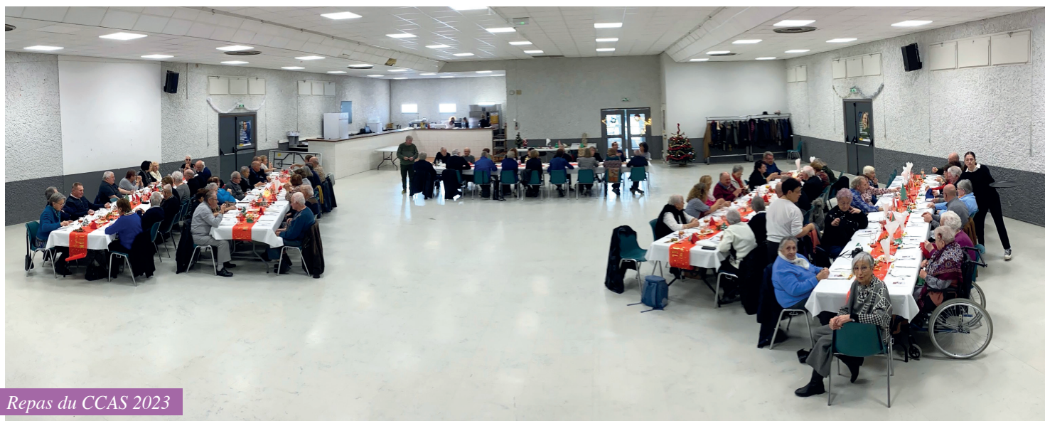
Repas du CCAS 2023

RAPPEL : un registre est ouvert en mairie pour connaître les personnes en situation fragile qui pourraient avoir besoin d'aide pour les périodes d'enneigement ou de canicule. Cela ne remplacera pas la vigilance et l'aide de la famille et du voisinage qui sont primordiaux lorsqu'on est une personne seule à son domicile.